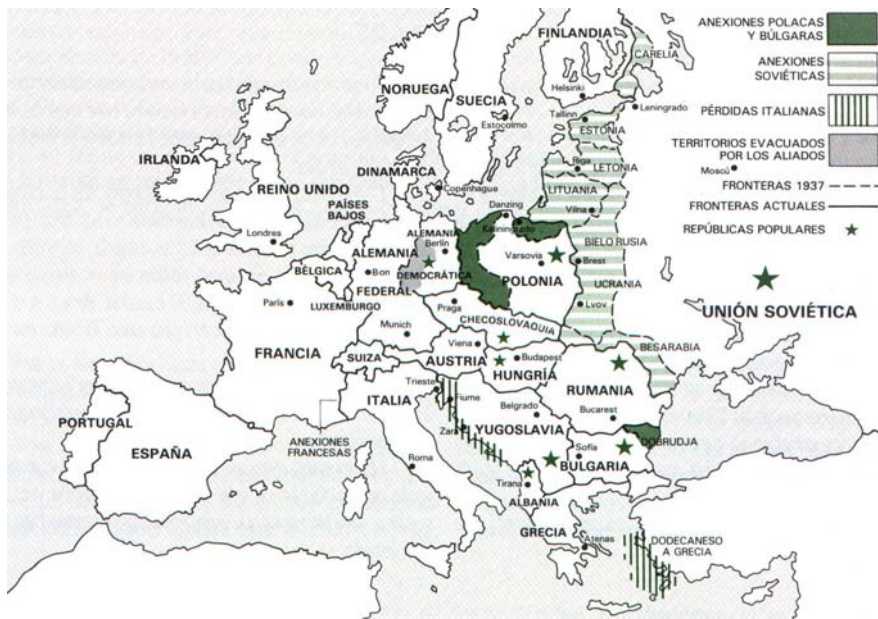
Cambios territoriales en Europa tras la II Guerra Mundial.

importantes, se desplazó al país hacia el Oeste. Por el Este pierde los territorios que le quita la Unión Soviética, pero se le compensa dándole una parte de Alemania: Silesia y parte de la Prusia Oriental.