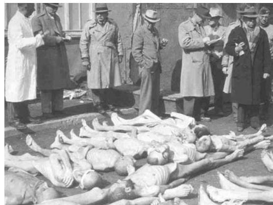
Campo de exterminio de judíos en Dachau en 1945.

La población civil ha sufrido duramente los ataques de los militares, además, en algunos casos se ha procedido a la eliminación sistemática de contingentes de población importantes (judíos, eslavos...). Se han hecho varios cálculos sobre el número de desaparecidos en la guerra, todos rondan sobre los 55 millones de personas, en algunos lugares desapareció toda la población masculina, pero la guerra no respetó tampoco a mujeres, ancianos y niños. Los países con más bajas fueron la Unión Soviética,