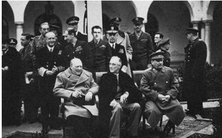
Conferencia de Yalta, febrero de 1945.

Churchill y Roosevelt se volvieron a reunir en Casablanca (Marruecos) del 14 al 23 de enero de 1943. Estados Unidos estaba ya en la guerra. El principal asunto tratado es coordinar el desembarco aliado que se produciría en Sicilia.