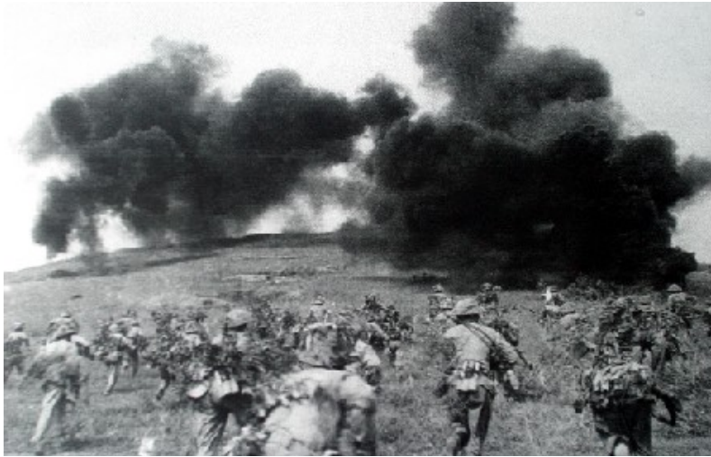
La derrota de Dien Bien Phu en 1954, marca el fin de la presencia francesa en Indochina.

Tras la independencia han estallado varias guerras entre los dos países, sobre todo por el territorio de Cachemira en el norte, de mayoría musulmana pero incorporado por la India. En la actualidad los dos países disponen de armas nucleares y la tensión en la zona se calienta periódicamente.