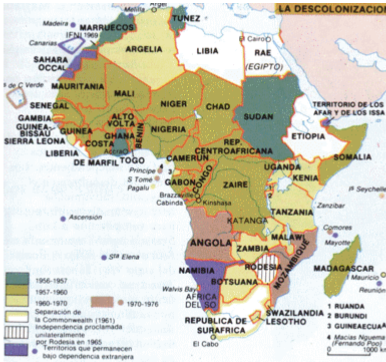
La independencia de los estados africanos.

pero consolidada en 1937, pero casi todo el territorio va a obtener su independencia en la década de los cincuenta.