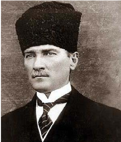
Mustafá Kemal, Ataturk, padre de la moderna Turquía y ejemplo a seguir por muchos pueblos.

nacionalismo es evidentemente europea, y los pueblos que intentan acceder a su independencia van a encontrar en ella una herramienta muy eficaz para luchar contra la dominación europea.