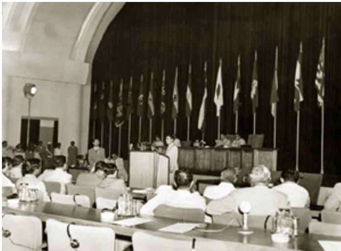
La Conferencia de Bandung (Indonesia) de 1955 supone un apoyo de los recién descolonizados a los pueblos todavía sometidos al colonialismo europeo.

Los Estados Unidos son partidarios de la independencia de los países colonizados, la ideología del presidente Wilson sobre la autodeterminación de los países ocupados va a ser para ellos un referente importante. Desde el otro bloque los escritos de Lenin contra el colonialismo y a favor de la independencia de los pueblos también van a tener un gran eco. Los distintos pueblos van a tomar estas ideas como referencia y los distintos movimientos independentistas estarán inspirados por estas dos ideologías.