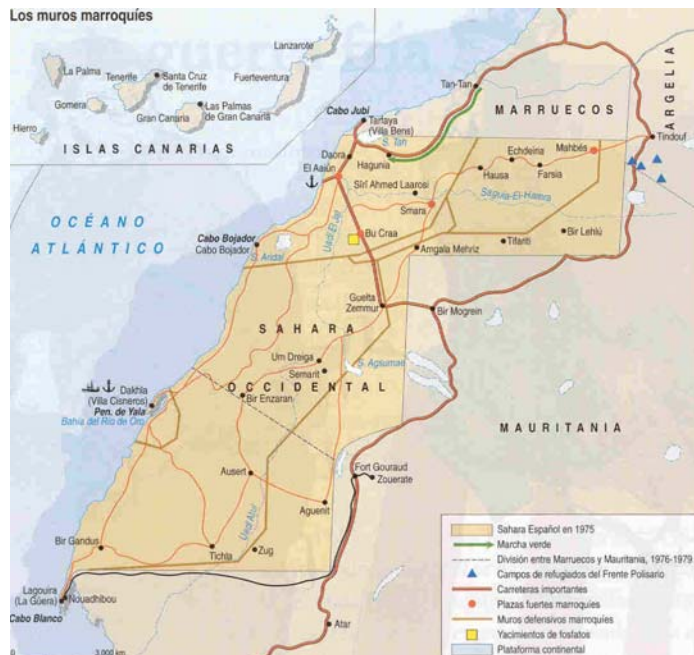
La entrega del Sahara Español a Marruecos y Mauritania en 1975 por España abocó a los saharauis a una guerra con Marruecos, potencia ocupante todavía hoy.

Tras dos plebiscitos en Argelia y en Francia se proclama la independencia del país el 1 de julio de 1962, como consecuencia de este hecho un millón de franceses abandona Argelia.