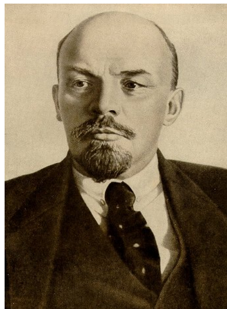
El comunismo también ejerció mucha influencia en estos pueblos.

Junto a estas dos corrientes ideológicas que se unen al nacionalismo, hemos de subrayar también que los