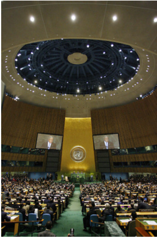
La ONU se mostró a favor de la descolonización de las colonias con la resolución 1514 de 1960.

países dominados van a tener una minoría culta que ha estudiado en la metrópoli y tiene un nivel cultural alto, esta minoría va a estar en contra de la dominación política y va a exigir también una independencia económica, que se invierta en el territorio y que no se vayan las materias primas a Europa.