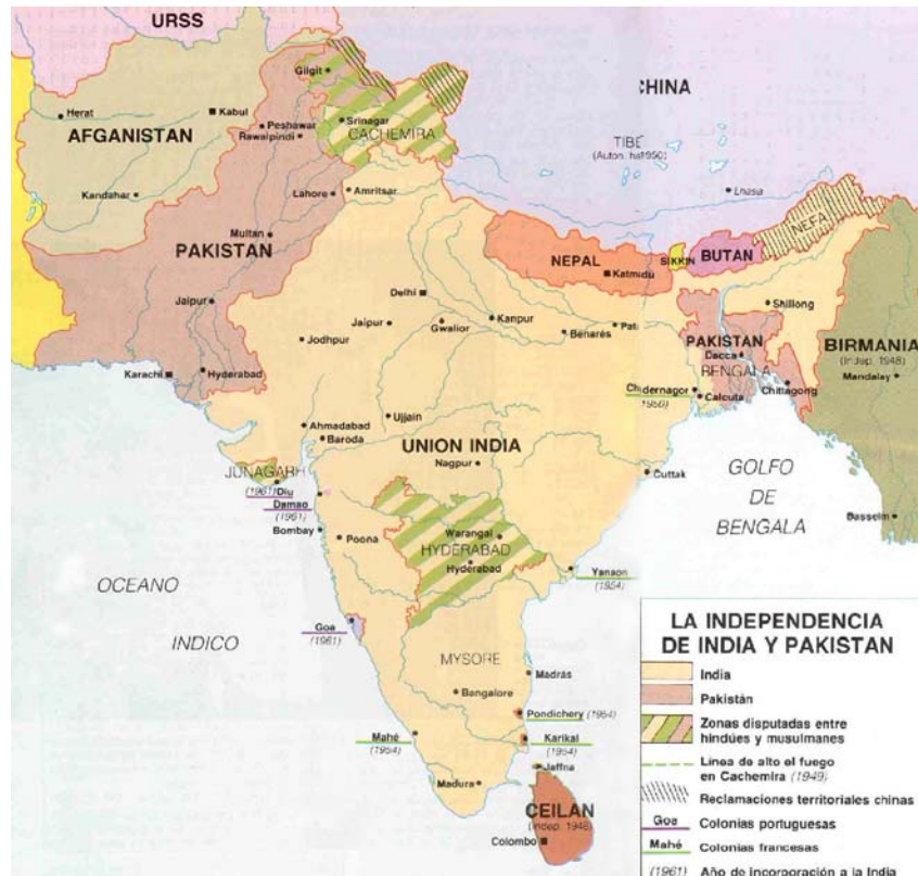
La partición de la India Británica dio lugar a dos nuevos países: la Unión India y Pakistán.

A finales de los años treinta y principios de los cuarenta hay una viva agitación por la independencia, los ingleses reaccionan con una dura represión que no hace más que exaltar aún más los ánimos. En el bienio de 1945 a 1947 se pacta la independencia del territorio, Gran Bretaña no puede mantener su posición pues está debilitada tras la II Guerra Mundial, el ascenso al poder de los laboristas, con Atlee a la cabeza, favorece el entendimiento con la colonia. Lord Mountbatten, último virrey de la India, procederá a dividir el territorio en dos estados distintos basándose en las rivalidades entre hindúes y musulmanes, fue una división precipitada y agravó aún más los problemas. Aparecían así dos estados: la India de mayoría hindú, aunque con una importante minoría de musulmanes y de otras religiones (sijs, católicos...) y Pakistán de mayoría musulmana pero fragmentado en dos territorios: Pakistán Occidental y Pakistán Oriental (éste último conseguiría su independencia en 1971 con el nombre de Bangla Desh).