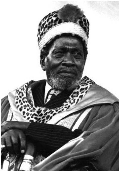
A la descolonización se llega muchas veces con un líder carismático, En la foto Jomo Kenyatta.

Al hablar de la descolonización veremos en primer lugar las causas o factores que posibilitan ese proceso. Hemos clasificado los factores en dos tipos: los internos, que se producen en los propios países, aunque sean a veces por influencias extranjeras; y los externos que se refieren más a la coyuntura internacional.