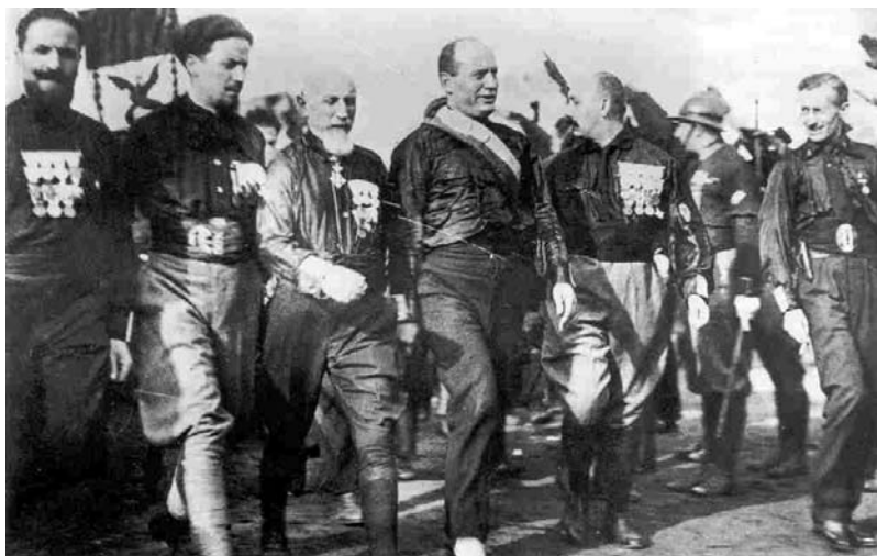
La Marcha sobre Roma, octubre de 1922.

el descontento de posguerra y funda en Milán los fasci di combattimento integrados por excombatientes, anarquistas, extremistas... y actuarán de forma violenta para reprimir huelgas y manifestaciones obreras. En el año 1920 al ocupar fábricas los socialistas y ante la impotencia del