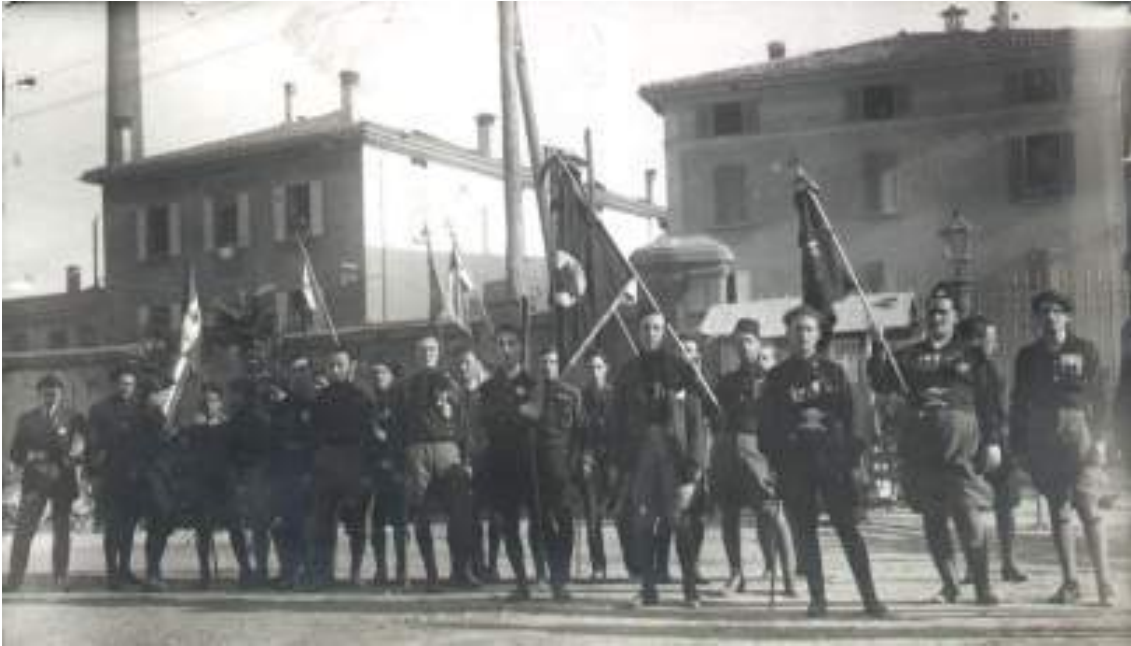
Un grupo de las Squadre d'Azione, dedicado a reventar huelgas obreras.

agricultura. Las principales zonas industriales se localizan en el norte del país y las diferencias entre el norte y el sur ( mezzogiorno ) son enormes. En las ciudades la reconversión de las industrias de guerra genera grandes masas de parados. A este panorama desastroso se une una inflación tremenda que genera un aumento espectacular de los precios mientras los salarios siguen congelados. Los problemas financieros del Estado no son menores, la deuda del Estado es de 63.000 millones de liras, una cifra enorme.