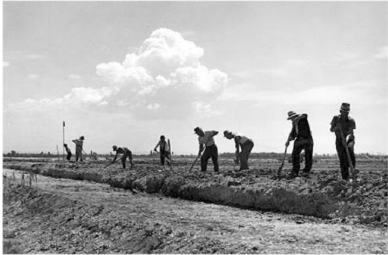
Las corporaciones sustituyen a los sindicatos de clase y ayudan al régimen a encuadrar y controlar la población.

1924. En 1924 Mussolini se hace también una ley electoral a su medida, en ella dice que el partido que obtuviese el 25% de los votos recibiría 2/3 de los escaños, así la oposición quedaba debilitada. El hecho más escandaloso de la violencia fascista fue el caso Matteotti , secretario general socialista que criticó la violencia fascista y el fraude en el recuento de votos, fue secuestrado y asesinado