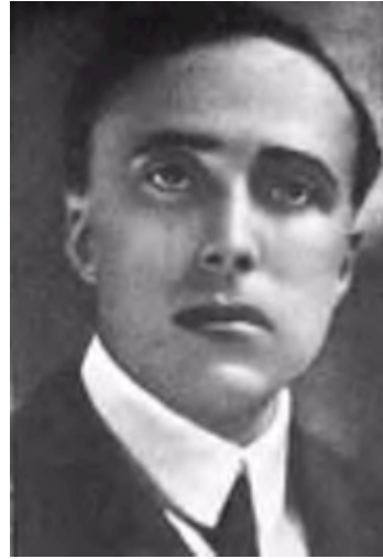
El asesinato de Matteotti.

Gobierno inicia una ofensiva contra los socialistas.