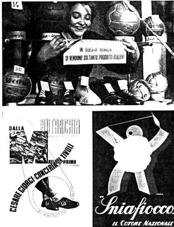
Carteles apoyando el consumo de productos italianos en el marco de la autarquía.

como si fueran batallas, en esta línea está la batalla del trigo que tenía como objetivo que Italia se autoabasteciera de ese producto sin tener que recurrir a la importación, el objetivo se cumplió pero a costa de sacrificar otros cultivos que sí hubo que importar. Otra preocupación es la creación de una lira fuerte para subrayar el prestigio del país, se mantuvo un cambio bajo para otras monedas más fuertes y esto se reflejó en una dificultad para la exportación de productos italianos.