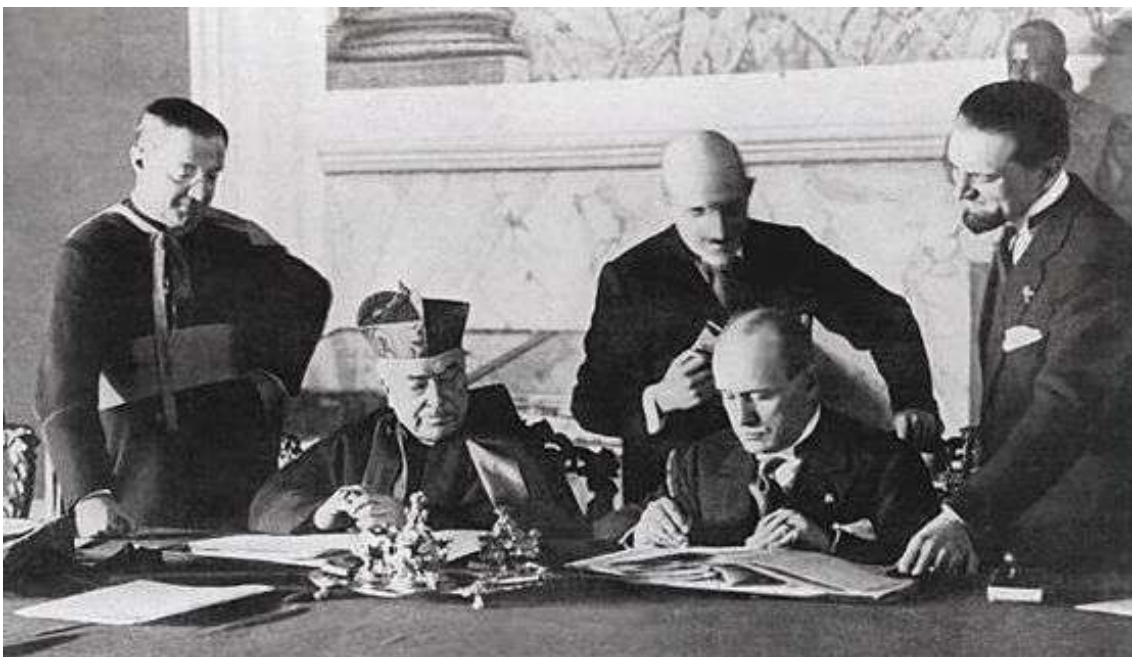
Firma del tratado de Letrán entre Italia y la Santa Sede.

Al llegar al poder los fascistas lo primero que hacen es pagar al gran capital los