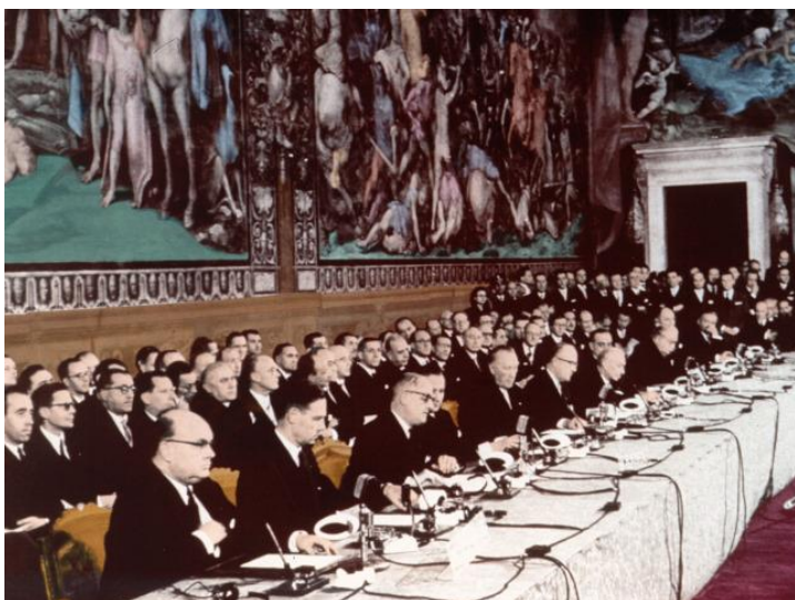
Firma del tratado de Roma en 1957.

Jean Monnet, se creaba, por el Tratado de París (1951), la Comunidad Europea del Carbón y del Acero (CECA) . La formaban seis países: Francia, Alemania, Italia, Bélgica, Holanda y Luxemburgo. Se trataba de una integración parcial o sectorial que fue un gran éxito. Para estos países, las fronteras, para el carbón y el acero, quedaban suprimidas. Por primera vez, unos Estados aceptaban renunciar a una parte de su soberanía para ejercerla de forma compartida.