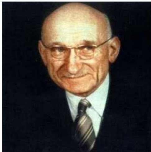
Robert Schuman (1886-1963)

A partir de 1950, en efecto, se daba el primer paso hacia la integración. A propuesta del ministro francés de Asuntos Exteriores, Robert Schumann, y de un plan de trabajo elaborado por