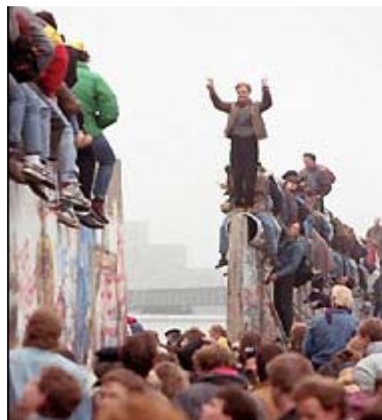
Caída del muro de Berlín el 9 de noviembre de 1989.