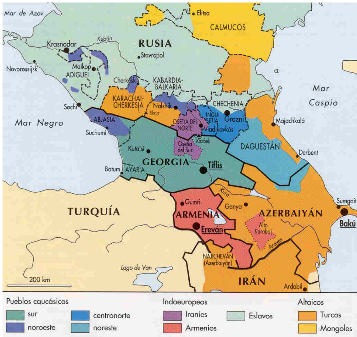
Complejidad étnica en el Cáucaso, clave para entender los conflictos continuos.