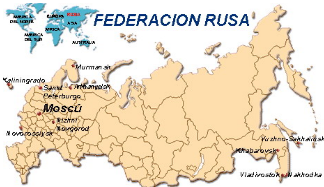
Mapa de la Federación Rusa, el país más extenso del mundo.

Los retos de Rusia son, por un lado, mantenerse como potencia militar y política, y por otro, crecer económicamente. En el tránsito hacia la economía de mercado se ha producido una caída de la producción y un incremento de precios. El nivel de vida de amplias capas de la población –pensionistas, obreros,... -ha empeorado, al tiempo que han aparecido los nuevos ricos , beneficiados de las privatizaciones y la especulación . En términos generales, se ha implantado un capitalismo salvaje, en el que la delincuencia organizada controla algunos sectores de la economía.