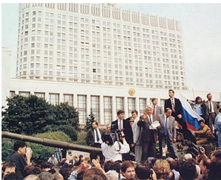
Yeltsin dirigiéndose a la multitud contra el golpe del 18 de agosto de 1991

Hundidos los regímenes comunistas en Centroeuropa, sólo se mantenía en Europa el modelo del socialismo real en la Unión Soviética. La revolución de agosto de 1991 constituye el último y más importante episodio en la cadena de cambios. El derrumbe del último bastión vendría propiciado por el fracaso del golpe de Estado del sector duro del PCUS y el KGB.