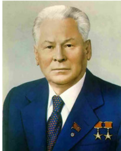
Yuri Andropov y Konstantin Chernenko.

tolerar ningún desvío de las líneas marcadas por Moscú. Occidente asistió expectante a los acontecimientos sin pronunciarse, la solución militar enfrió aún más las relaciones entre los dos bloques.