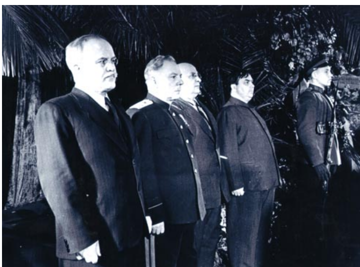
De izquierda a derecha: Molotov, Voroshilov, Beria y Malenkov en el entierro de Stalin.

Stalin muere el día 5 de marzo de 1953, si la sucesión de Lenin había sido difícil, a la muerte de Stalin se iba a producir también una lucha por el poder. Al principio hay un claro reparto de poderes y los principales líderes encabezan las instituciones dentro de una dirección colegiada: el renovador Krushev controlaba el partido, Beria la policía, Malenkov el Estado, Molotov la diplomacia y Bulganin el ejército. Malenkov está bien colocado, pero el