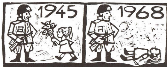
Cartel checo criticando la intervención soviética.