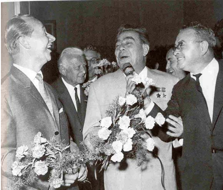
Breznev y Dubcek semanas antes de la Primavera de Praga.

de la soberanía limitada , cualquier intento aperturista era cortado, el punto culminante fue 1968 con la invasión de Checoslovaquia en lo que se dio en llamar Primavera de Praga . De todas formas también sería un error analizar la etapa de Breznev como una continuación de la de Stalin, Breznev no realizó ninguna purga masiva y su figura discreta no toleró el culto a su personalidad, por lo menos no de una forma tan descarada como Stalin.