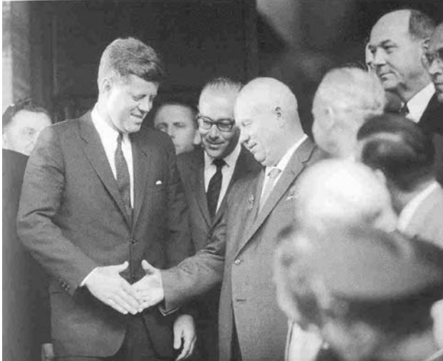
Kennedy y Krushev en Viena en 1961.