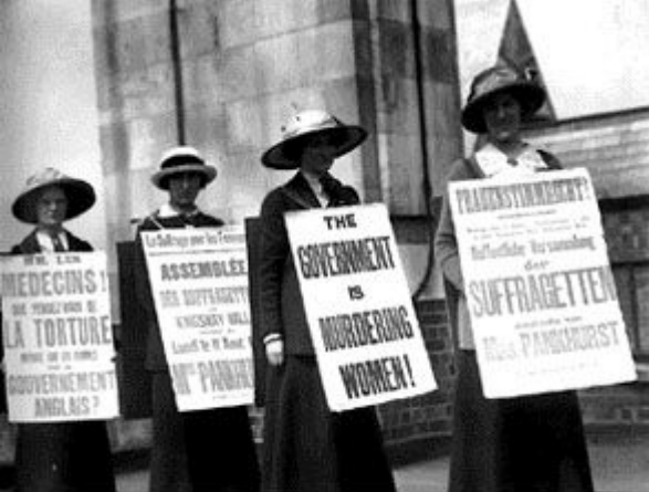
Partidarias del sufragio femenino británico a principios del siglo XX