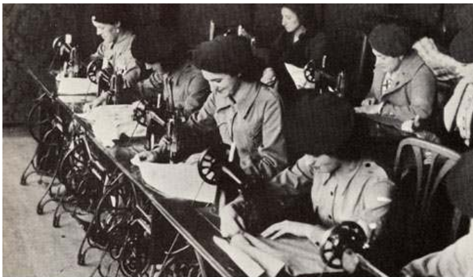
"Margaritas" cosiendo ropas de abrigo para los combatientes en un taller de costura de la organización carlista de Frentes y Hospitales

fueron perdiendo toda su influencia en el seno del partido unificado de Falange Española y Tradicionalista de las JONS. La delegación de Frentes y Hospitales se apresuró a desarrollar otro tipo de actividades asistenciales tras la guerra pero el 24 de mayo de 1939 apareció un decreto extinguiendo la delegación.