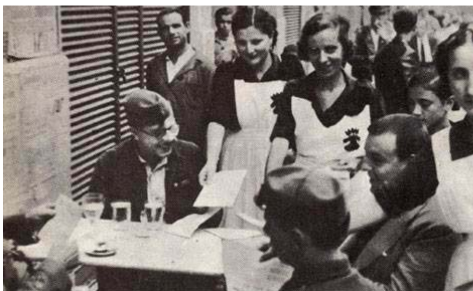
Cuestación organizada por la Sección Femenina de Falange

Sin embargo no sólo existía la Sección Femenina como organización de encuadramiento de las mujeres. En el amplio espectro social femenino encontramos dos delegaciones que también intentaron, aunque sin éxito, atribuirse el papel predominante como reguladoras del esfuerzo femenino en la guerra. Tras el decreto de Unificación se distribuyen las funciones femeninas entre la Sección Femenina (encargada como hemos visto de la movilización y formación de todas las mujeres), la Delegación de Frentes y Hospitales (encargada de las atenciones al frente) y el Auxilio Social (que se ocupa de la función benéfica).