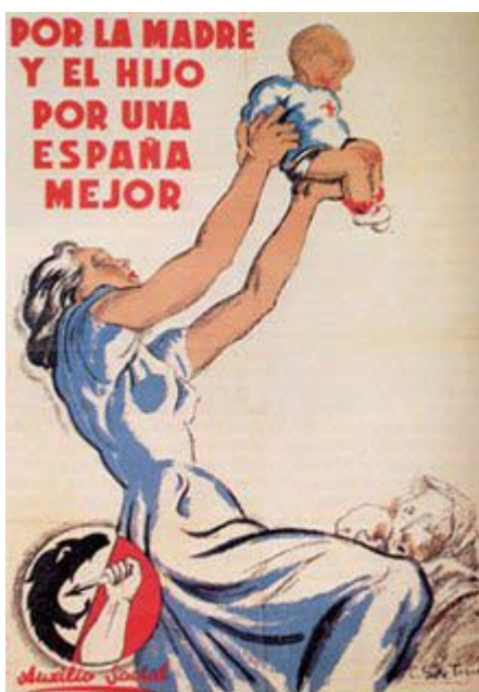
Cartel que reivindica el papel de las mujeres en la España nacional

La situación de la mujer en la España nacional es la historia de una vuelta a la sociedad patriarcal y a un papel de sumisión que parecía olvidado durante el régimen republicano. La nueva España de Franco tendrá como objetivo la difusión de valores y pautas de comportamiento que para las mujeres tienen un significado ideológico y social muy marcado. La familia y el hogar serán sus principales ámbitos de actuación sin olvidar las labores asistenciales.