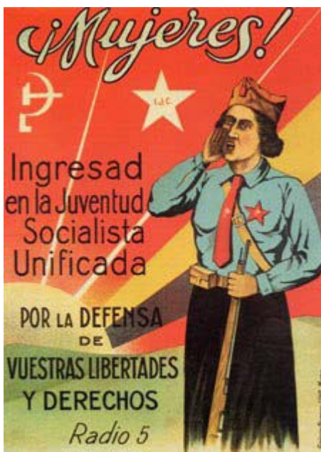
Cartel de la organización comunista J.S.U. incitando a la mujer republicana al ingreso

famosas desempeñarían papeles notorios e importantes en la guerra. Entre ellas figuran Margarita Nelken, socialista que se convirtió al comunismo durante la guerra, la socialista Matilde Huici, la republicana Victoria Kent, la republicana de Esquerra Catalana Dolors Bargalló y la anarquista Lucía Sánchez Saornil. La movilización popular femenina englobaba a miles de mujeres españolas hasta entonces marginadas de la sociedad y cultura española, que se comprometieron en el empeño colectivo de combatir el fascismo.