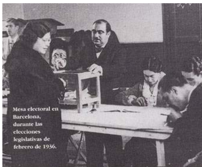
Mesa de las elecciones de febrero de 1936. La República otorgó el voto a las mujeres en 1931

Por último tenemos las dificultades de la mujer en el ámbito social víctimas de un sistema patriarcal que las discriminaba. Rechazaban abiertamente las normas de género que las confinaban al hogar. Poco a poco en un proceso lento y gradual desde el siglo XIX empezaron a hacerse oír. Ello era debido principalmente al nuevo rol desempeñado por la incipiente industrialización del país que les otorgaba un nuevo papel que traspasaba su hasta entonces situación en la esfera doméstica y las catapultaba al ámbito público de la producción, la política y el cambio social. El desarrollo inicial del movimiento obrero posibilitó una cada vez mayor integración femenina en las asociaciones de clase y su creciente incorporación al trabajo les hizo sentirse partícipes de las reivindicaciones laborales. Por tanto, las mujeres empezaron a identificarse como un colectivo social que demandaba igualdad y derechos políticos.