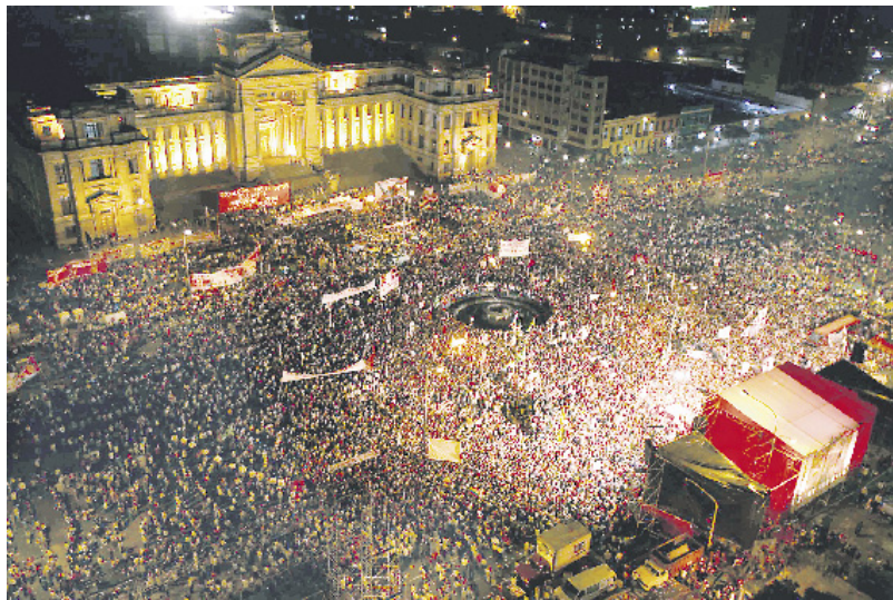
Mítin electoral en Lima (Perú) en las elecciones de de 2006.

manos de quienes les han concedido apoyo económico. La necesidad de fondos que los militantes no pueden aportar ha contribuido a utilizar métodos de financiación irregular, y bastantes veces ha desembocado en casos de corrupción, con la consiguiente merma de confianza del electorado en la transparencia de las finanzas de los partidos políticos.