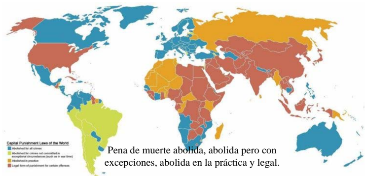
La pena de muerte en el mundo.

El partido único se confunde aquí con el aparato del Estado, al frente del cual se sitúa un presidente que es a la vez líder del partido, jefe religioso o dirigente del grupo oligárquico establecido en el poder. En este contexto, la violencia es el medio más frecuente de relación entre el gobierno y sus opositores. Los movimientos armados se convierten en la única salida de una oposición que no dispone de recursos democráticos para expresarse ni de garantías democráticas para alcanzar el poder. En contraposición, el Estado legitima la violencia institucional como único medio para mantener orden social.