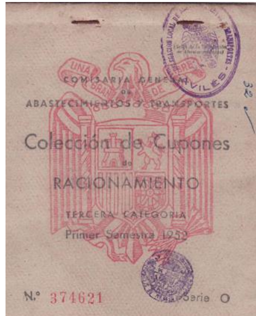
Portada de una cartilla de racionamiento.

La marginación de España del Plan Marshall (1948-1952), impidió al país acceder a créditos que hubieran facilitado una pronta recuperación económica. Pero a partir de 1953 y con la consolidación de la Guerra Fría, EE.UU. concedió créditos a España para la compra de productos agrícolas, materias primas y equipo industrial. Sin duda, los problemas de escasez se suavizaron y también permitieron la eliminación del