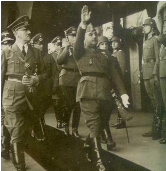
Encuentro entre Hitler y Franco en Hendaya.

gobiernos de Franco -participan todas las familias políticas del régimen-, pero, por otro, en esta primera fase hay un predominio cualitativo y cuantitativo de la Falange, debido al papel de Alemania en la escena internacional. El hombre fuerte de esa etapa es Serrano Súñer "el Cuñadísimo".