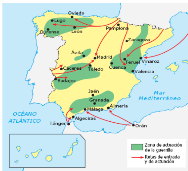
Zona de actuación de los maquis.

Entre 1944 y 1950 intervinieron en varias zonas, y su acción más espectacular fue la ocupación del valle de Arán. Pero el aislamiento entre los diferentes grupos de guerrilleros, la represión militar y de la Guardia Civil, y el recuerdo de la guerra, experiencia que la población civil no quería repetir, explican su fracaso. En la década de 1950, la oposición interior experimentó tres cambios significativos: la renuncia a la práctica violenta, la transformación social y generacional de sus miembros y el impulso de la actuación opositora en las universidades y en el seno de los sindicatos franquistas, para aprovechar las elecciones a enlaces sindicales y jurados de empresa, embriones del sindicato Comisiones Obreras. Las acciones más frecuentes de la oposición eran las convocatorias de huelga, aunque eran ilegales, en las que se reivindicaban mejoras económicas.