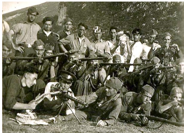
Un grupo de maquis. Granada, 1948.

El maquis se constituyó como una guerrilla diseminada por las montañas, de inspiración principalmente comunista y con apoyo local que no daban la guerra por perdida. Se nutrían de antiguos milicianos republicanos y de nuevos aportes venidos del exterior curtidos en la lucha en Francia contra los nazis.