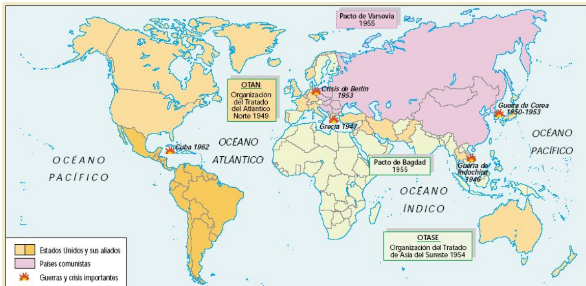
Los bloques en la guerra fría.

Este enfrentamiento se producirá con altibajos hasta la caída del muro de Berlín y la desaparición del comunismo fruto de la política de Gorbachov a partir de 1989. En algunos momentos la tensión fue tan grande que se rozó la guerra nuclear, un ejemplo es la crisis de los misiles de Cuba en 1962. Lo normal es que las dos superpotencias no se