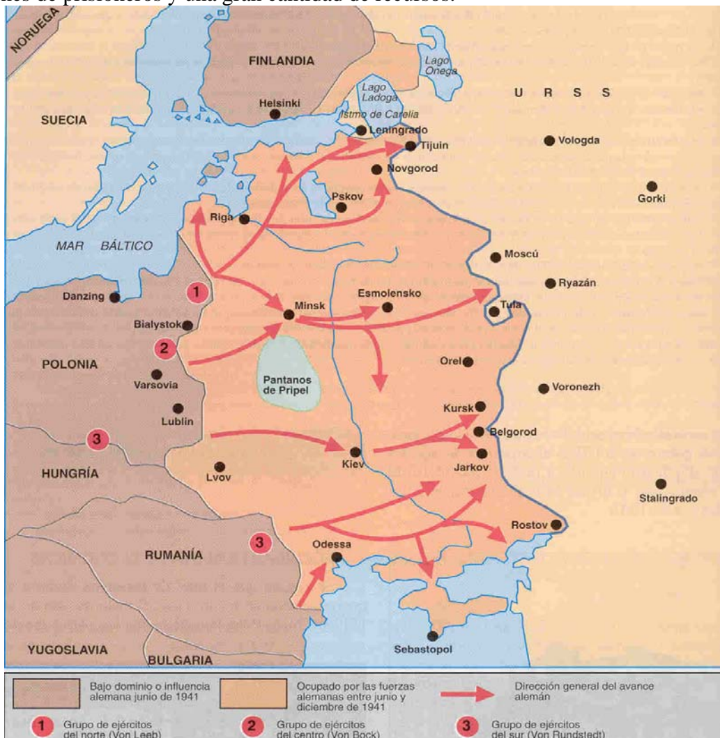
La operación Barbarroja.

fábricas ucranianas al otro lado de los Urales como había hecho con muchas rusas. En estas condiciones el avance alemán es imparable: rápidamente caen Bielorrusia, gran parte de Ucrania, Estonia, Letonia y Lituania, los alemanes llegaron a cortar las comunicaciones con Leningrado (San Petersburgo). En sus manos cayeron más de tres millones de prisioneros y una gran cantidad de recursos.