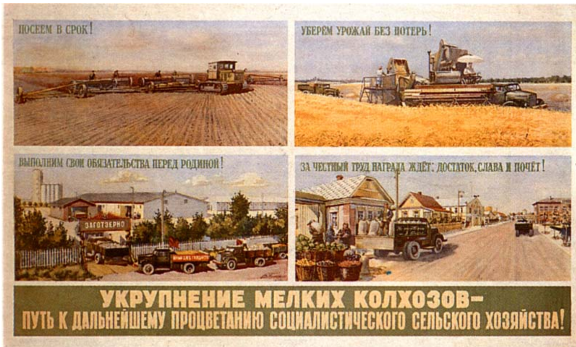
Poster propagandístico de la planificación económica.

Pero a pesar de todos estos problemas el país tenía muchas bazas para ganar la guerra. En primer lugar, la planificación económica 1 hace que el Estado controle fuertemente la economía, y esto, en una situación de guerra, es una clara ventaja. Los planes quinquenales han duplicado la capacidad productiva del país, se ha acelerado de forma espectacular la industria pesada y con ella la bélica, la Rusia de 1939 no es ni mucho menos la Rusia de 1914 cuando los ejércitos alemanes barrieron a las tropas del zar. Con la ocupación alemana el control de la economía se intensifica, se pone en marcha una economía de guerra, todo para el frente es la consigna, el campesino ruso no ha mejorado su nivel de vida desde hace decenios y está acostumbrado a terribles sacrificios.