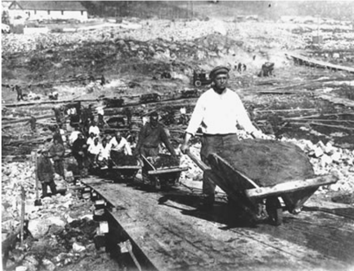
Prisioneros trabajando en un gulag.

Como consecuencia de los cambios de frontera se produjeron de nuevo masivos traslados de población. En las regiones recientemente incorporadas Stalin asentó a un porcentaje variado de rusos para intensificar la integración en la Unión y eliminar cualquier tipo de aspiración nacionalista. De estos nuevos territorios fueron expulsados casi medio millón de personas con destino, principalmente, a Kazajstán y Siberia en Asia. A estos contingentes hemos de añadir el de los pueblos castigados a los que se acusaba de traidores y de colaborar con los alemanes, miles de georgianos, ucranianos y rusos fueron deportados a los desiertos del Asia Central o a Siberia. Los judíos