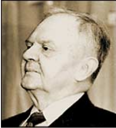
Jdanov, creador de la Kominform

Estados Unidos contará con todas las democracias europeas occidentales, toda América (menos Cuba que escapará en 1959), gran parte de Asia y de África. La U.R.S.S. cuenta en Europa con los países que durante la II Guerra Mundial ha ocupado el Ejército Rojo y que no abandona, a ellos se unirá Checoslovaquia, más tarde se incorpora China al bloque comunista, aunque no en calidad de sometido, y otros países descolonizados de Asia y África. Dentro de cada bando cada aliado muestra una uniformidad ideológica, económica y política con su líder.