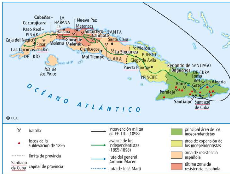
Mapa de la guerra de Cuba.

El período más idóneo para hacer concesiones a las reivindicaciones cubanas fue el Gobierno largo de los liberales cuando el Partido Autonomista Cubano se mostraba decidido a apoyar un programa reformista propiciado por Madrid, que restase fuerza y apoyos sociales a los independentistas.