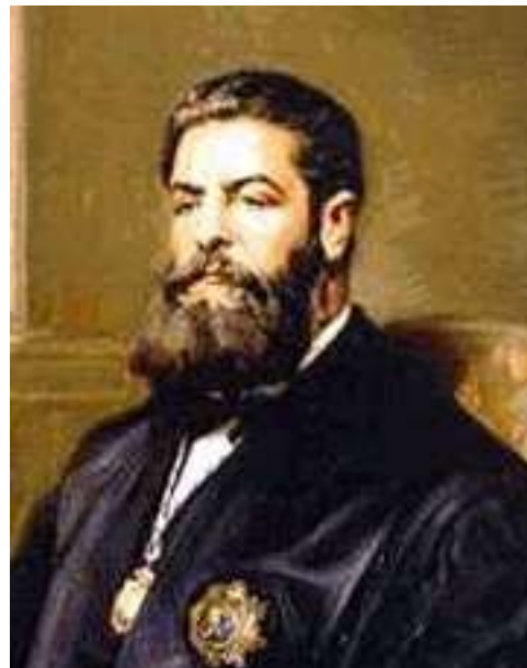
Joaquín Costa (1846-1911).

Tras el 98 surgieron una serie de movimientos regeneracionistas que contaron con cierto respaldo de las clases medias y cuyos ideales quedaron ejemplificados en el pensamiento de Joaquín Costa, que propugnaba la necesidad de dejar atrás los mitos de un pasado glorioso, modernizar la economía y la sociedad y alfabetizar a la población ("escuela y despensa y siete llaves al sepulcro del Cid "). También defendía la necesidad de organizar a los sectores productivos de la vida española al margen del turno dinástico con unos nuevos planteamientos que incluyesen el desmantelamiento del sistema caciquil y la transparencia electoral.