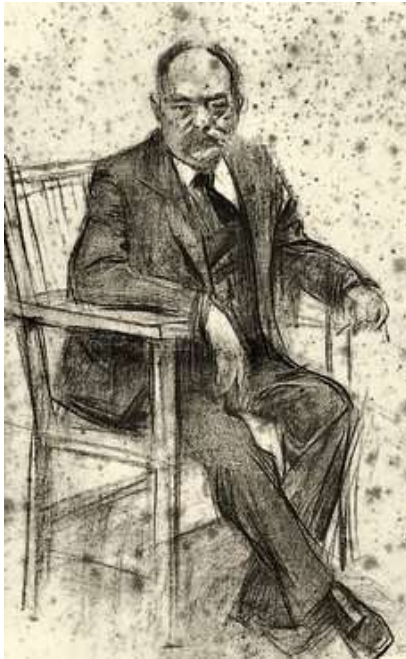
Valentí Almirall (1841-1904).

Las primeras formulaciones catalanistas con un contenido político vinieron de la mano de Valentí Almirall , un republicano federal decepcionado, que fundó el Centre