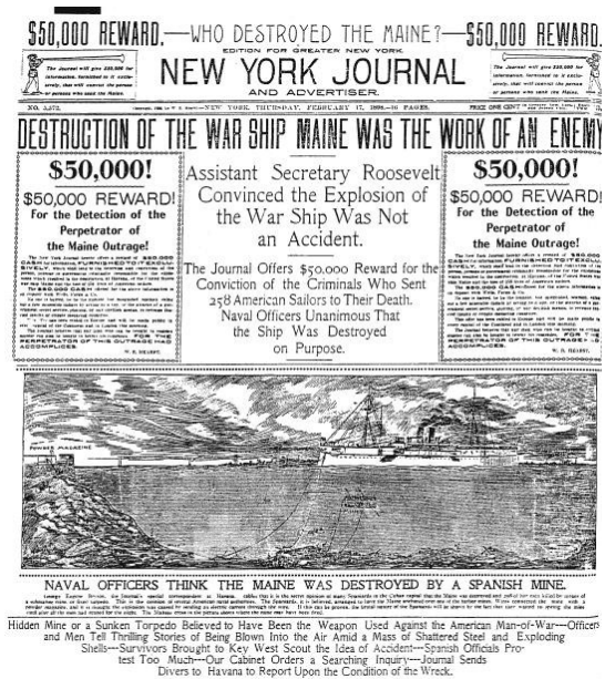
Periódico norteamericano con el hundimiento del Maine.

La derrota de 1898 sumió a la sociedad y a la clase política española en un estado de desencanto y frustración. Para quienes la vivieron, significó la destrucción del mito del