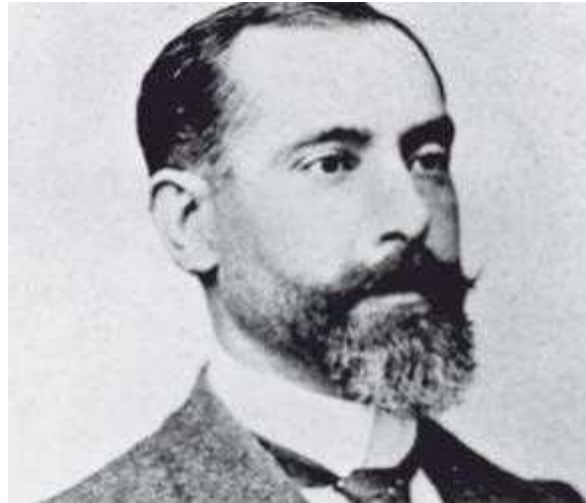
Sabino Arana y Goiri (1865-1903).

El propulsor del nacionalismo vasco, Sabino Arana, desde una perspectiva fuerista tradicional, se limitó en los años noventa a recoger y dar coherencia a estas ideas que flotaban en la sociedad, y las depuró: para un pueblo "diferente" -de raza y, sobre