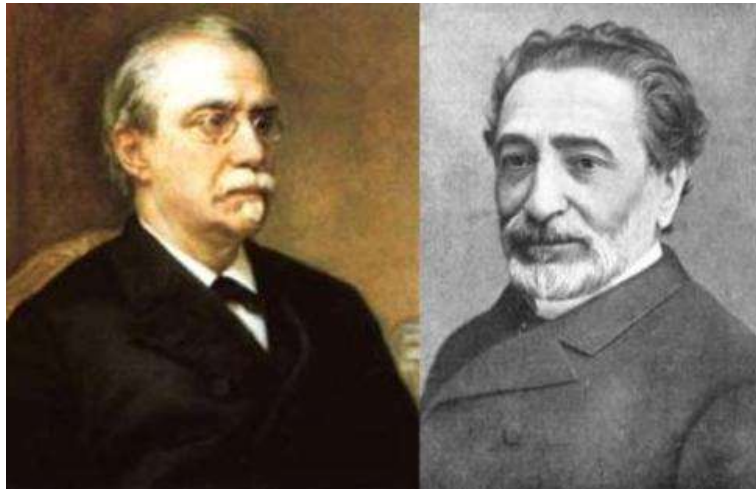
Antonio Cánovas del Castillo (1828-1897) y Práxedes Mateo Sagasta (1825-1903).

Todas estas prácticas fraudulentas se apoyaban en la abstención de una buena parte de la población, cuya apatía electoral se explica tanto por no sentirse representada como por el desencanto de las fuerzas de la oposición en participar en el proceso electoral. En general, la participación electoral no superó el 20% en casi todo el período de la Restauración.