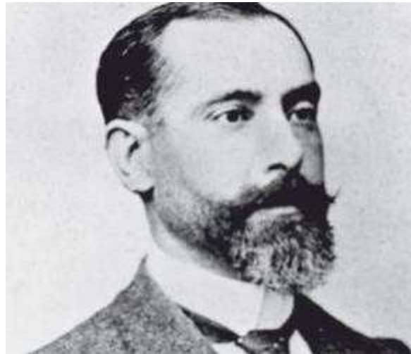
Sabino Arana y Goiri (1865-1903).

El 31 de julio de 1895 se fundó el Partido Nacionalista Vasco con una solemne declaración antiespañola y con una voluntad de restaurar en el territorio el orden jurídico tradicional. Pero el partido no fue capaz de conseguir nada mientras se mantuvo en la órbita de los primeros seguidores de Arana -la pequeña burguesía bilbaína tradicionalista- por lo que se vio obligado a ampliar sus bases hacia una burguesía más moderna e industrial.