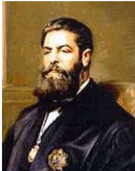
Joaquín Costa (1846-1911).

Además, el "desastre" dio cohesión a un grupo de intelectuales, conocido como la Generación del 98 (Unamuno, Valle Inclán, Pío Baroja, Azorín...). Se caracterizaron por su profundo pesimismo, su crítica frente al atraso peninsular y plantearon una profunda reflexión sobre el sentido de España y su papel en la Historia.