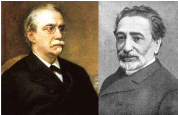
Antonio Cánovas del Castillo (1828-1897) y Práxedes Mateo Sagasta (1825-1903).

La confluencia de los particularismo regionales, el espíritu romántico y el renaci-