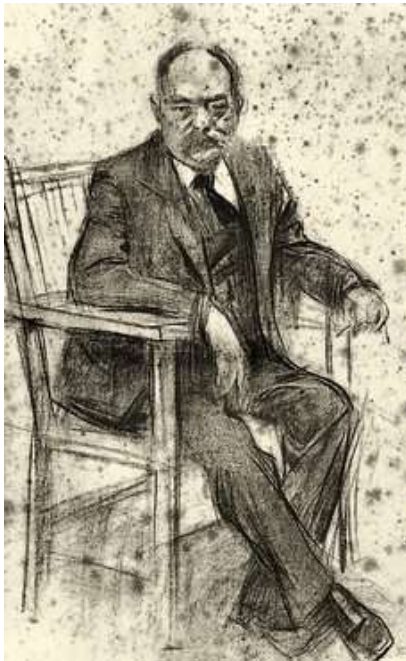
Valentí Almirall (1841-1904).

Las primeras formulaciones catalanistas con un contenido político vinieron de la mano de Valentí Almirall , un republicano federal decepcionado, que fundó el Centre