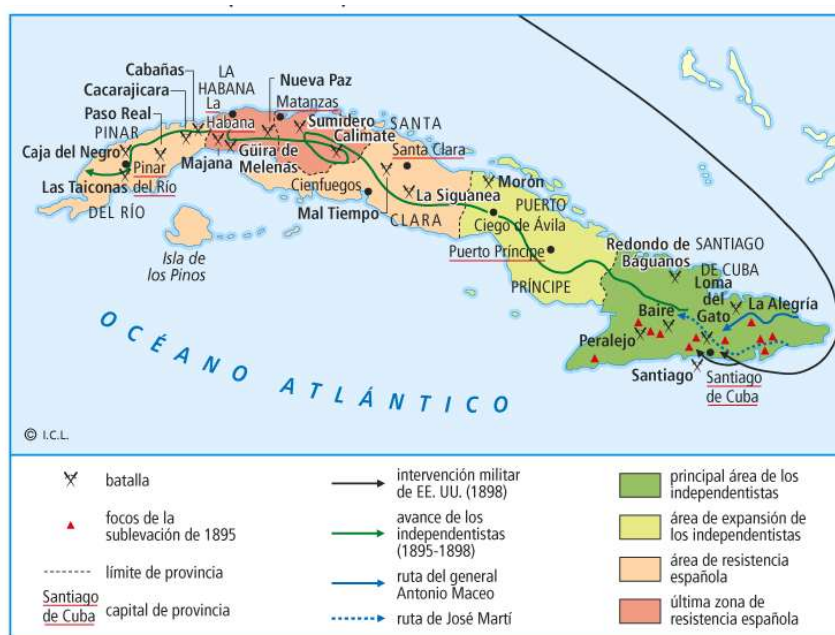
Mapa de la guerra de Cuba.

El período más idóneo para hacer concesiones a las reivindicaciones cubanas fue el Gobierno largo de los liberales cuando el Partido Autonomista Cubano se mostraba decidido a apoyar un programa reformista propiciado por Madrid, que restase fuerza y apoyos sociales a los independentistas.