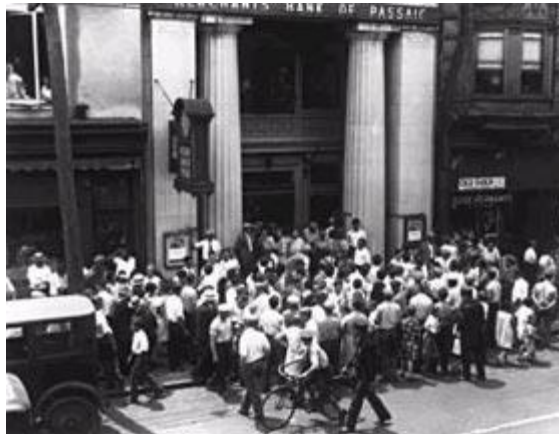
Ahorradores intentando retirar su dinero de un banco.

En la última semana de octubre se produce la explosión, el desplome de la bolsa. Desde el 21 se acumulaban las órdenes de venta, viendo que la cosa iba mal muchos quieren vender sus acciones para recuperar su dinero; como había más órdenes de venta que compradores el precio de las acciones baja. Esta tendencia a la baja se ve frenada unos días por la compra de muchas acciones por la Banca Morgan. El 24 de octubre de 1929 , llamado el “ jueves negro ”, se produce un desplome espectacular de la bolsa, 13 millones de acciones salen al mercado y no encuentran comprador, ese desajuste entre la oferta y la demanda hace que el valor de las acciones caiga en picado. El 29 de octubre , el “ martes negro ”, son ya 16 millones, el pánico es tremendo, todo el mundo quiere vender para recuperar algo del capital. Empieza una crisis que durará varios años. En la primavera de 1930 la Banca Morgan saca al mercado las acciones que había acumulado, de nuevo el pánico es tremendo y se produce la ruina de millares de accionistas modestos. Para hacernos una idea de lo que está pasando diremos que el valor de las acciones de la Chrysler pasa de 135 a 5, y en la Steel de 250 a 22. La bolsa se ha desinflado.