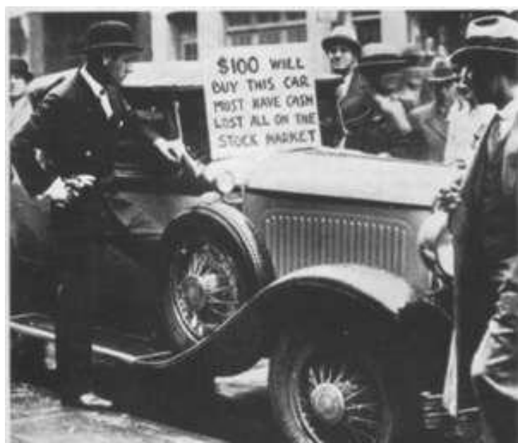
Ante la crisis un particular vende su coche en EE.UU.

La crisis de la bolsa acabó afectando a todos los sectores económicos . En el sistema bancario , los que habían tomado dinero a préstamo ahora no podían devolverlo; los particulares, temerosos de perder sus depósitos los retiraban. Las entidades bancarias no podían reponer los depósitos por la falta de recursos. Era la crisis bancaria . Más de 4.000 bancos quebraron y desaparecieron.