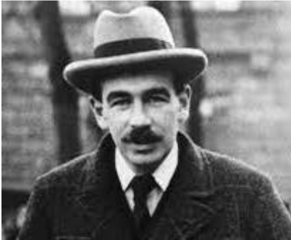
John Maynard Keynes (1883-1946).

Para salir de la crisis contarán con una poderosa industria armamentística en la que Hitler colocó a casi todos los parados que pasaron de 6 millones a 400.000, el