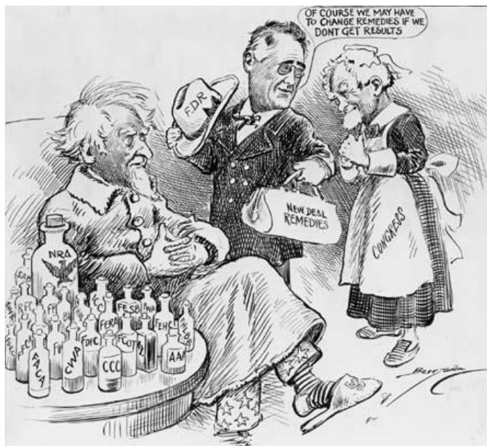
Caricatura del New Deal: Roosevelt como doctor trata a un moribundo (economía).

La última medida tomada fue la reforma de la bolsa , con la creación de una Comisión de Valores y de Cambios encargada de regular la emisión de acciones y de velar por el buen funcionamiento de la bolsa.