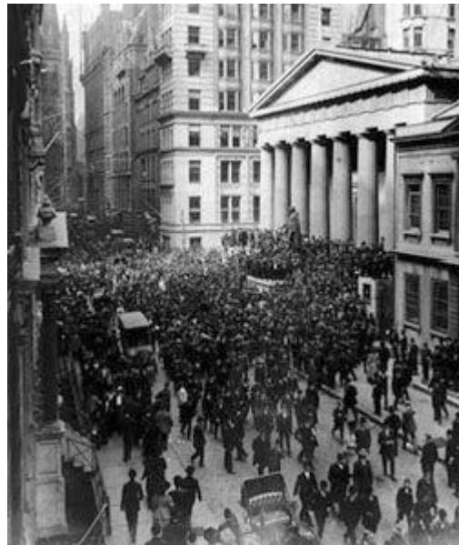
Wall Street el Jueves Negro.

La mayoría de los autores se fijan en el comportamiento de la bolsa de Wall Street (bolsa de Nueva York), cuya espectacular caída provocó una grave crisis financiera y económica en EE.UU. Ahora bien, la caída brusca de la bolsa era un eslabón más en la cadena y será la importancia económica de Estados Unidos (primer productor mundial, primer mercado mundial) la que hará que la caída arrastre a muchos países y la crisis tenga unas dimensiones mundiales. Veamos lo que pasó.