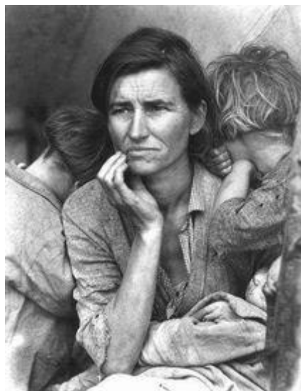
Las consecuencias en el campo fueron terribles.

Las consecuencias de la crisis fueron tremendas en todos los aspectos. Además del desastre económico como la quiebra de los bancos, el cierre de muchas empresas y la ruina de los campesinos, en el aspecto social , humano si se quiere, las consecuencias fueron también terribles: paro, indigencia, aumento de la delincuencia. Desde el punto de vista político los Estados, que hasta entonces habían seguido el lema de dejar libremente a la economía van a adoptar un intervencionismo creciente para intentar evitar la repetición de una crisis como esta. En Europa, debido a la crisis, van a subir los partidos de corte autoritario que proponen un control de la economía por el Estado, en esa línea Hitler sube al poder en 1933. Desde el punto de vista intelectual también afectó la crisis y se creó una generación de intelectuales y artistas con una visión pesimista de la vida.