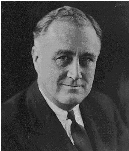
El presidente americano Franklin D. Roosevelt.

Estados Unidos es el primer productor mundial y también el principal mercado , tiene invertidos capitales por todo el mundo, principalmente en Europa, América Central y América del Sur, y al producirse la crisis los va a retirar . Las dimensiones mundiales de la economía estadounidense explican que EE.UU. trasladara la crisis al resto del mundo.