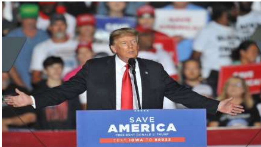
Mitin electoral de Donald Trump en las elecciones presidenciales de EEUU de 2016.

También ha perjudicado la salud de la democracia el protagonismo de los medios de comunicación , ya que son los que canalizan y construyen buena parte de la opinión pública. La guerra de estos medios por la audiencia ha convertido la legítima oposición política en un "espectáculo" de la política, que otorga un gran poder mediático a las grandes cadenas televisivas o radiofónicas y a la prensa. Un segundo orden de