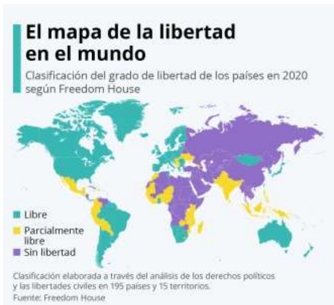
El grado de libertad en el mundo en 2020.

dictaduras o en los países en guerra, las ejecuciones sumarias, es decir, sin juicio previo y que pueden llegar a afectar a miles de personas, que son asesinadas por su origen étnico, su religión o ideología política. Los asesinatos en masa de elevados contingentes de población civil, en la que son numerosas las mujeres y los niños indefensos, han proliferado en numerosas guerras, y en casos como los de Bosnia o Ruanda se puede incluso hablar de genocidio.