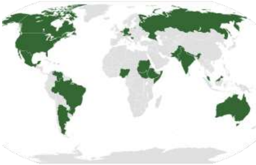
Países del mundo con estructura federal.

El modelo de Estado federal parte del reconocimiento de la personalidad de los diversos Estados que lo integran, y cada uno de ellos goza del derecho a legislar y a tener sus propias instituciones políticas. El poder y las responsabilidades políticas quedan, pues, repartidos entre los diversos Estados y el poder federal. Este último suele ocuparse de los asuntos referentes a política internacional, economía, defensa y seguridad. Es el