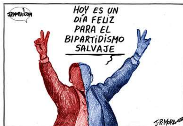
Aunque el pluripartidismo está teóricamente garantizado, se impone un bipartidismo real en muchos países.

La mayoría de los sistemas democráticos europeos (Francia, España e Italia) se basan en el multipartidismo. En el espectro de partidos democráticos predominantes, podemos distinguir tres grandes familias ideológicas: los conservadores, defensores de los derechos individuales y partidarios de mantener el orden social y de reducir la intervención del Estado; los demócratacristianos,