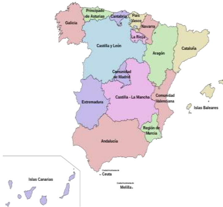
España es un país formalmente unitario pero su estructura autonómica se parece mucho a un funcionamiento federal.

confesionales de carácter conservador, pero con mayor sensibilidad por los temas de justicia social; y los socialistas, que otorgan al Estado un papel importante como redistribuidor de la riqueza a partir de la política fiscal. Este abanico puede ampliarse con los partidos comunistas, nacionalistas, ecologistas, etc., que suelen configurar importantes minorías parlamentarias. Cuando ningún partido consigue la mayoría suficiente para garantizar la elección del presidente del Gobierno, suelen realizarse alianzas, y los partidos bisagra se convierten en un elemento