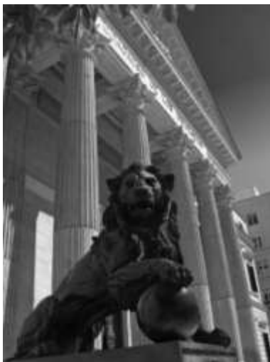
En los sistemas democráticos en el Parlamento es donde reside la soberanía popular.

Los Estados democráticos desarrollan un sistema de democracia parlamentaria en la que el papel predominante de la vida política lo desempeña la Asamblea de diputados o Parlamento, elegida por sufragio universal. Esta asamblea ejerce el poder legislativo y elige al presidente del Gobierno, que tiene el poder ejecutivo y es responsable ante ella, de tal manera que, cuando pierde el apoyo mayoritario, el gobierno se ve obligado a dimitir.