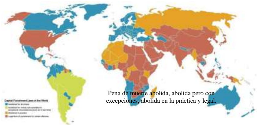
La pena de muerte en el mundo.

poder. En este contexto, la violencia es el medio más frecuente de relación entre el gobierno y sus opositores. Los movimientos armados se convierten en la única salida de una oposición que no dispone de recursos democráticos para expresarse ni de garantías democráticas para alcanzar el poder. En contraposición, el Estado legitima la violencia institucional como único medio para mantener orden social.