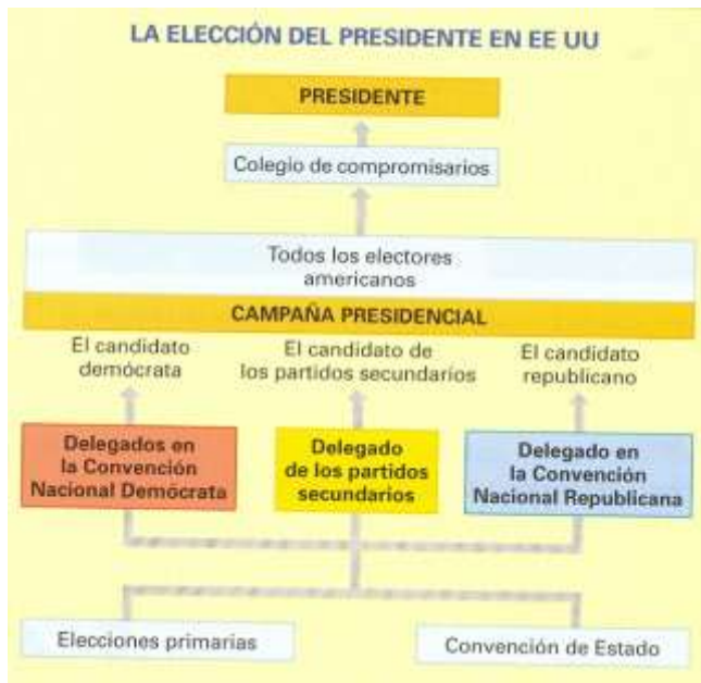
La elección del presidente en EE.UU.

Estado es el encargado de nombrar como presidente del Gobierno al líder del partido que ha obtenido la mayoría de los votos en las elecciones a la Asamblea de diputados. La preponderancia del parlamento otorga a los partidos políticos un papel de primer orden en la vida política del país. Ellos elaboran las candidaturas a las elecciones y organizan los grupos parlamentarios entre los diputados electos de cada partido.