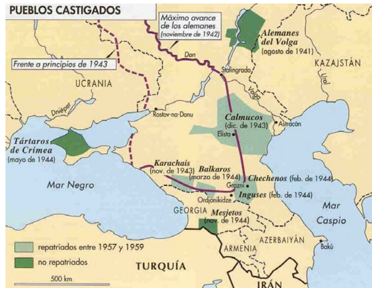
La xenofobia en el caso ruso se manifiesta en el traslado de millones de soviéticos por pertenecer a una raza determinada.

Una idea constante en la ideología marxista es el rechazo del nacionalismo que se considera una herramienta de la burguesía y el capitalismo, Marx había dicho que los obreros no tienen patria . En esta línea el colectivo no es la nación sino la sociedad comunista, sociedad que tenía que extenderse por todo el mundo a través de la revolución. Era el universalismo marxista frente al ultranacionalismo fascista. El hecho de que el comunismo antes de la II Guerra Mundial sólo se diera en la Unión Soviética le daba a ésta la fuerza moral para patrocinar la creación de partidos comunistas en todo el mundo supeditados a la URSS y cuyo objetivo sería la conquista del poder y la instauración de regímenes comunistas hermanos.