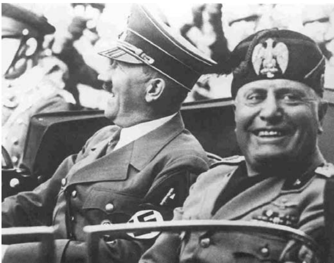
Hitler y Mussolini máximos exponentes de l totalitarismo fascista.

Por totalitarismo entendemos los regímenes políticos no democráticos que se caracterizan por el poder todopoderoso del Estado, que se infiltra en todos los aspectos de la vida, tanto públicos como privados. El Estado es fuerte y se sustenta sobre un