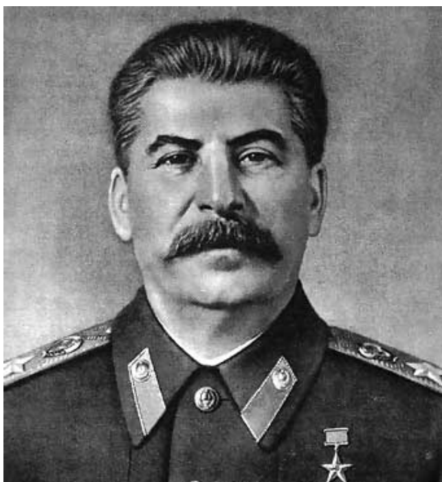
J. Stalin, principal representante del totalitarismo comunista.

para referirse al estado fascista casi dos décadas antes. Como vemos sirve para designar a regímenes políticos radicalmente distintos desde el punto de vista ideológico, pero muy similares en cuanto a los procedimientos utilizados para obtener el poder y conservarlo. Los regímenes totalitarios tuvieron su edad de oro en los años treinta, como consecuencia de la crisis del 29 surgieron en toda Europa gobiernos autoritarios que sustituyeron a los regímenes democráticos en gran parte de los países europeos del este y del sur. Tras la Segunda Guerra Mundial, y derrotado el fascismo, casi todos los países de la Europa del Este se van a convertir en estados totalitarios comunistas.