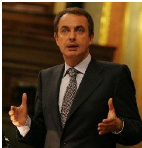
José Luis Rodríguez Zapatero (2004- 2011).

Las elecciones de 2008 revalidan el triunfo de Zapatero . Si la legislatura anterior había sido de crecimiento y un deterioro de la economía al final, en esta, la crisis –negada machaconamente por el Gobierno al principio de su andadura- estará omnipresente . El ejecutivo de Zapatero pone en marcha un amplio abanico de medidas para enderezar la economía que genera un profundo malestar: reforma laboral, recortes sociales de todo tipo (12 de mayo de 2010)... pero nada puede evitar el colapso económico del sector financiero y el de la construcción, pilares en los que se asentaba el crecimiento de la etapa anterior. El paro alcanza la cifra récord de casi 5 millones de personas. En este clima el PP gana las elecciones autonómicas, de manera aplastante, en gran parte de las comunidades en mayo de 2011, es sólo un anticipo de lo que pasará el día 20 de noviembre, en esa fecha se desarrollan elecciones generales anticipadas que dan la mayoría absoluta al Partido Popular liderado por Mariano Rajoy .