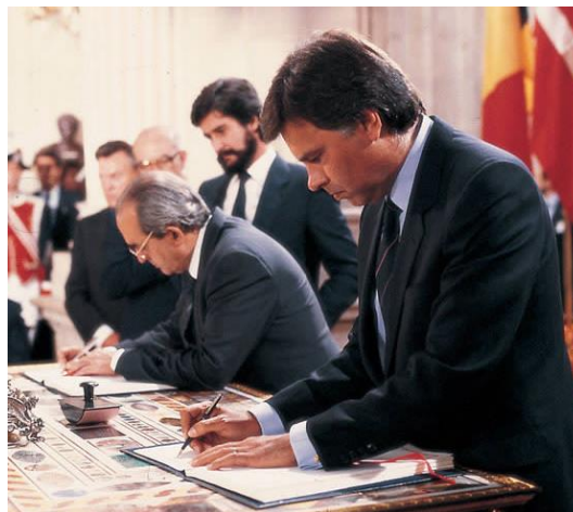
Felipe González Márquez firma el acta de adhesión de España a la Comunidad

Las elecciones del 28 de octubre de 1982 dieron el triunfo al PSOE, con el mensaje electoral del “ cambio ” y a su líder Felipe González Márquez , con más de diez millones de votos favorables y la mayoría absoluta en las Cortes. El primer problema que tuvo que tratar el nuevo gobierno, y que no había sido abordado durante toda la transición, era el de la grave situación económica que necesitaba medidas urgentes y duras. Entre estas: la devaluación de la peseta, subida de los tipos de interés, aumento de los impuestos... La medida más espectacular fue el proceso de reconversión industrial que llevó al cierre de muchas empresas siderometalúrgicas que no eran rentables.