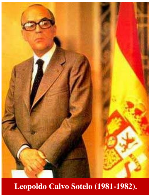
Leopoldo Calvo Sotelo (1981-1982).

Dos días después del golpe, Calvo Sotelo era nombrado presidente de un gobierno que duraría año y medio y que estaría presidido por las disensiones internas en el seno de la UCD; sin embargo, el intento de golpe de Estado contribuyó a rebajar la tensión política.