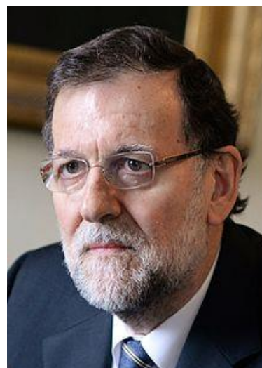
Mariano Rajoy (2011-2018).

El 20 de diciembre de 2015 se desarrollan unas elecciones generales ganadas por el Partido Popular pero sin mayoría suficiente para gobernar. Las negociaciones con otras fuerzas durarán meses, y al final acabará en fracaso y serán necesarias nuevas elecciones para el 26 de junio de 2016 , los resultados de estas confirman los anteriores datos; el entendimiento sigue siendo difícil. Por fin el 31 de octubre de 2016 , con el apoyo de varios grupos, Mariano Rajoy juró su cargo como presidente del Gobierno. La legislatura se caracterizó por la aparición de numerosos casos de corrupción.