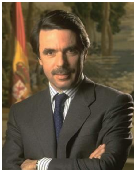
José María Aznar López (1996-2004).

empezaron a aparecer los primeros casos de corrupción que afectarían al partido en el gobierno.