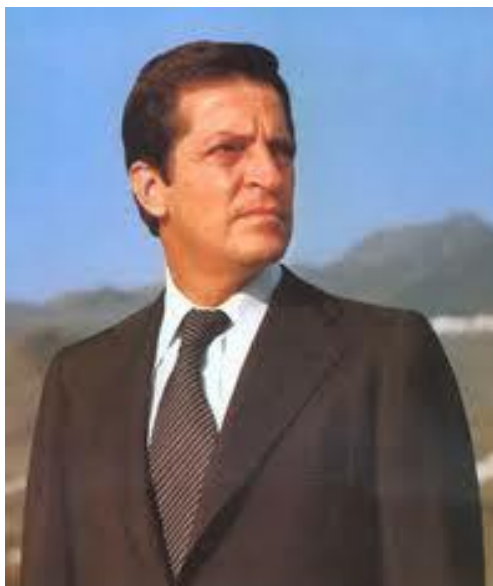
Adolfo Suárez González (1976-1981).

El gobierno de Suárez seguía en su empeño de acabar con el franquismo desde el franquismo . La tarea no era tan fácil y hubo momentos en que el objetivo de instaurar la democracia podía verse frenado. Veremos a continuación los pasos más importantes hasta la celebración de las elecciones generales el 15 de junio de 1977: