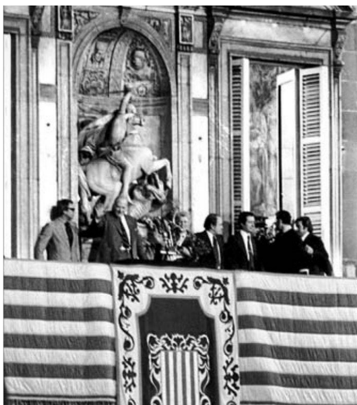
J. Tarradellas (1899-1988) saluda desde el balcón del palau de la Generalitat el 23 de octubre de 1977.

los sucesivos gobiernos habían aparcado la toma de decisiones en este sentido y ahora la situación era insostenible: una inflación situada en el 24,7% en 1977, aumento del paro, déficit exterior galopante... El gobierno de Suárez propuso un pacto a todas las fuerzas políticas y sindicales para combatir la crisis, basado en la contención de los salarios, la devaluación de la peseta, una política monetaria restrictiva para reducir la masa monetaria en circulación, proceder a una reforma fiscal... Estos acuerdos, conocidos como los Pactos de la Moncloa , fueron aprobados por todas las formaciones el día 27 de octubre de 1977. Como se comprueba, el consenso fue la tónica dominante, todas las formaciones se comprometieron a luchar contra la crisis, incluyendo a la patronal y a los sindicatos. Esta política de consenso culminaría en la elaboración de la Constitución.