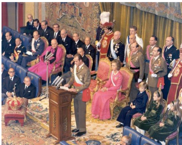
Acto de coronación de D. Juan Carlos. (22-XI-1975).

A la muerte de Franco, el rey mantuvo al frente del gobierno a Arias Navarro , un convencido franquista al que no se le podía pedir, como se vio desde muy pronto, que liderara la transición hacia un sistema político democrático. No obstante, Arias Navarro incorporó a su gobierno políticos de corte aperturista (Manuel Fraga, José M a de Areilza y Antonio Garrigues) e inició algunos cambios: concedió un indulto, permitió la actuación, de hecho, de los partidos políticos.