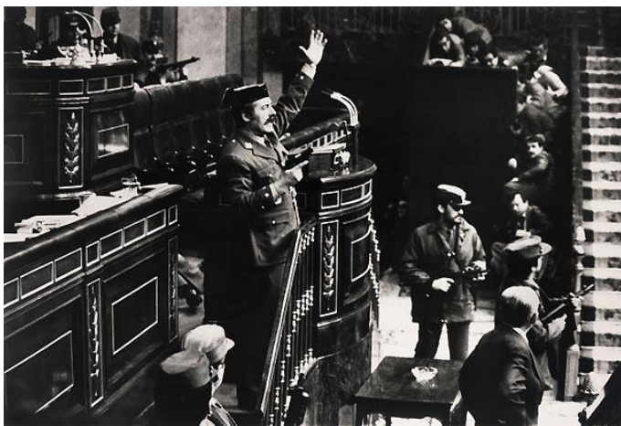
Tejero dirigiéndose a los diputados (23-II-81)