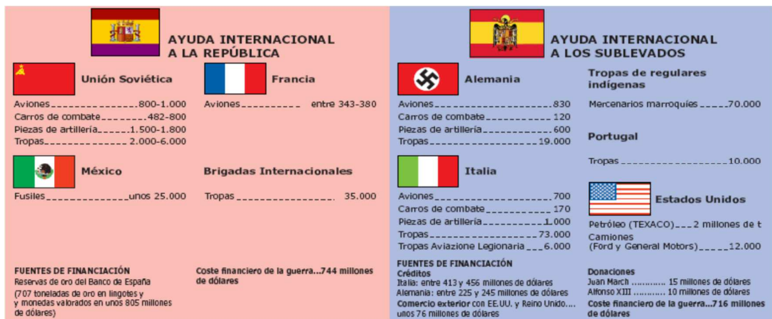
Ayudas internacionales a los dos bandos contendientes.

La ayuda soviética tuvo que ser pagada con el oro del Banco de España, el llamado