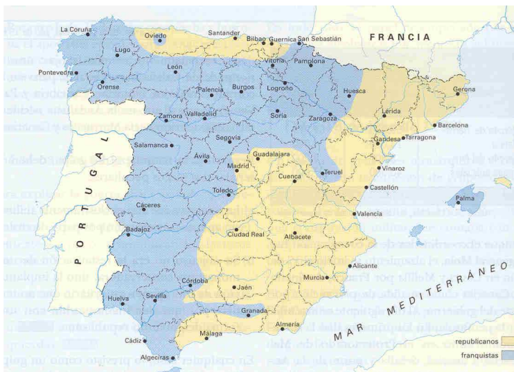
La guerra en noviembre de 1936: intentos infructuosos para tomar Madrid.

El primer gran revés republicano es la conquista por Franco de toda la cornisa cantábrica, Vizcaya, Santander y Asturias, lo que se consuma entre abril y octubre de 1937. Al mando del general Mola , que fallecería en junio en un accidente de aviación, al final de marzo empieza el ataque a Vizcaya con un ejército en el que juegan gran papel los requetés carlistas, artillería y aviación alemana y las tropas italianas.