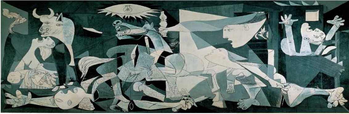
Picasso pintó para el pabellón de la República Española en la Expo de París este cuadro, impactado por el bombardeo del día 26 de abril de 1937 de esa población vasca.

La batalla de Teruel comienza el 15 de diciembre con iniciales éxitos republicanos, que toman la ciudad el 7 de enero de 1938. Franco, un mes después, ordenaba la contraofensiva y el 22 de febrero reconquista Teruel.