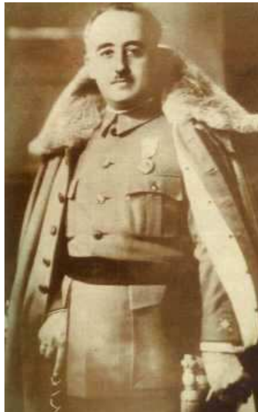
Franco (El Ferrol 1892-Madrid 1975) concentraba en su persona todos los poderes políticos y militares de la España nacional.

Las consecuencias políticas fueron el final de la experiencia modernizadora y democratizadora que España había decidido iniciar en 1931 y el inicio de un larguísimo período de represión, de falta de libertades políticas y la supresión de derechos fundamentales de las personas.