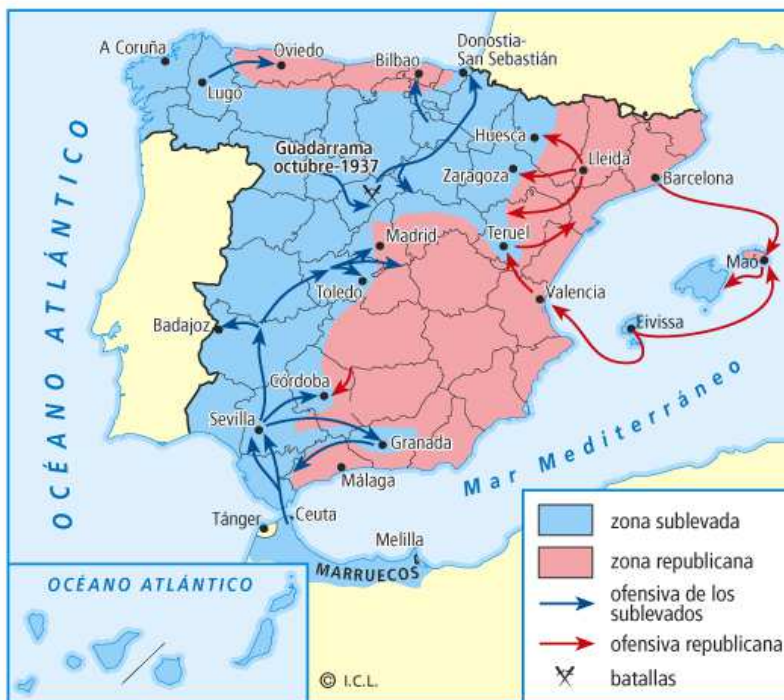
Avance de las fuerzas sublevadas entre julio y noviembre de 1936.

La batalla de Madrid fue un conjunto de acciones durante cinco meses de combate, ciclo al que pertenecen las batallas del Jarama y Guadalajara . La lucha en torno a Madrid comporta el primer gran revés para los planes de guerra de los sublevados y condiciona