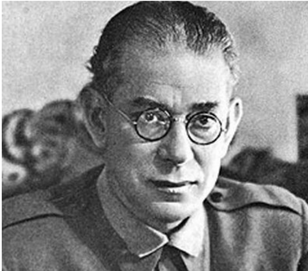
Emilio Mola, "El Director" de la sublevación.