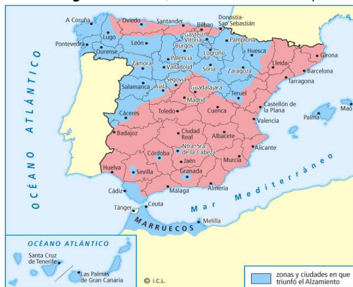
España al inicio de la Guerra, julio de 1936.

Al fracasar Mola, el protagonismo recayó en el Ejército de África al mando de Franco . A comienzos de agosto, gracias a la ayuda de la aviación alemana e italiana se estableció un “ punto aéreo ” para transportar el Ejército de Marruecos a la Península; iniciado el 5 de agosto, dos días después, Franco estaba en Sevilla. Sus tropas fueron avanzando con el objetivo final de conquistar Madrid. Siguiendo el plan, columnas mandadas por Yagüe avanzan hacia el norte por Extremadura. El 11 de agosto ocupan Mérida ; el 14, Badajoz . Se conseguía a su vez enlazar las dos zonas sublevadas. Penetran después en la provincia de Toledo. El 3 de septiembre ocupan Talavera , nudo estratégico de gran valor, pero entonces Franco decide desviar el avance y acudir en socorro de los sitiados en el Alcázar de Toledo , donde el coronel Moscardó aguanta el asedio republicano. Liberado el Alcázar, el 27 de