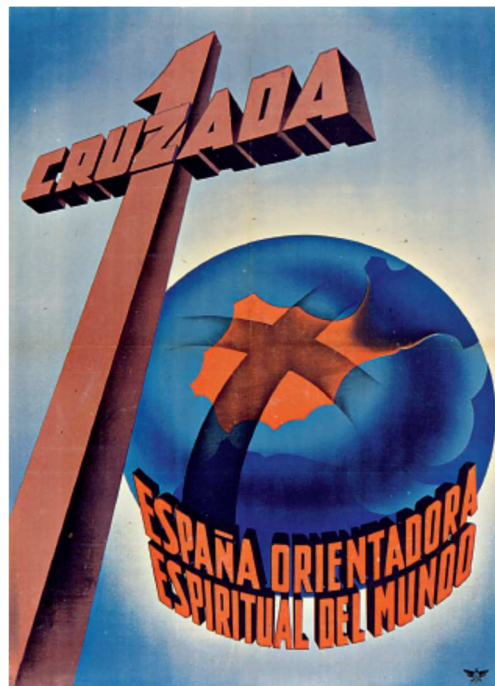
Cartel del bando sublevado, en él expresa la lucha como una cruzada espiritual.

El paso siguiente, en efecto, fue el Decreto de Unificación , obra de Serrano Súñer, de abril de 1937, por el que Franco se constituyó en jefe nacional del partido único que, con el nombre de Falange Española Tradicionalista y de las JONS , fusión de falangistas y carlistas, bajo la jefatura de Franco, surgía para agrupar las fuerzas políticas que se habían unido a la sublevación. En pocos meses, Franco reunía en su persona todo el poder: el Ejército, el gobierno del Estado y el partido único.