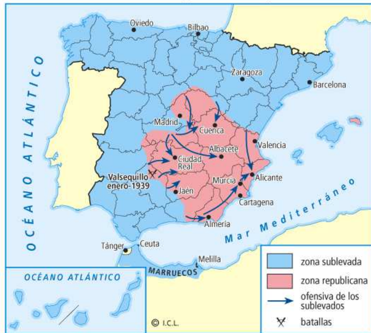
Guerra Civil en marzo de 1939.

El 23 de diciembre de 1938 inició Franco su ofensiva final en Cataluña. Ocupada ya Lérida (antes de la batalla del Ebro), Tarragona cae el 15 de enero y Barcelona , sin luchar, el día 26. Después, el 4 de febrero caía Gerona . Al día siguiente, Azaña y Negrín cruzaban la frontera, sin embargo, Negrín decidió regresar para ponerse al frente de la zona republicana (Centro-Este-Sureste), con el objetivo de continuar la resistencia: “¡Resistir es vencer!”, pero en la zona republicana el cansancio de la guerra estaba extendido entre la población.