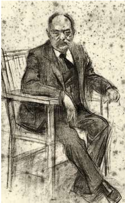
Valentí Almirall (1841-1904).

Las primeras formulaciones catalanistas con un contenido político vinieron de la mano de Valentí Almirall , un republicano federal decepcionado, que fundó el Centre