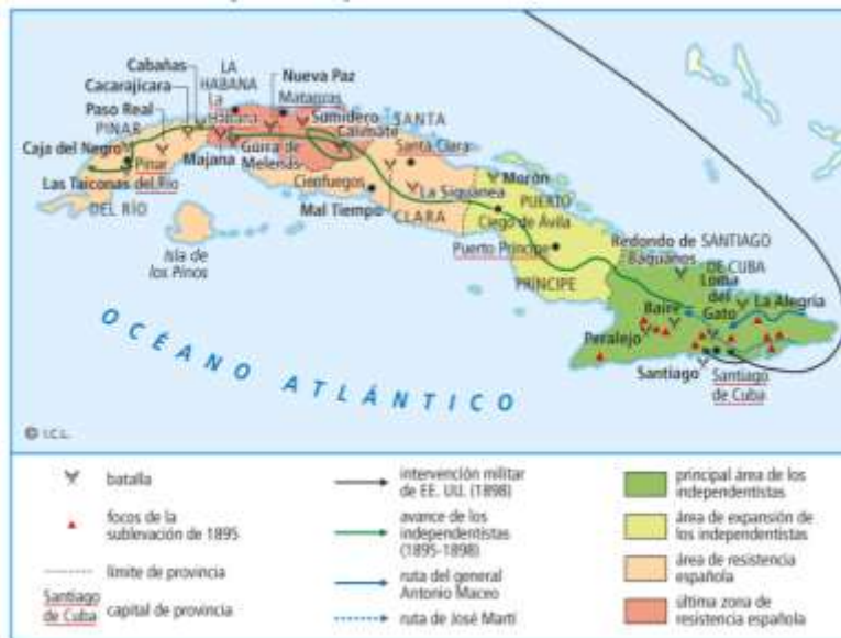
Mapa de la guerra de Cuba.

El período más idóneo para hacer concesiones a las reivindicaciones cubanas fue el Gobierno largo de los liberales cuando el Partido Autonomista Cubano se mostraba decidido a apoyar un programa reformista propiciado por Madrid, que restase fuerza y apoyos sociales a los independentistas.