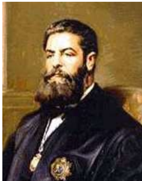
Joaquín Costa (1846-1911).

Tras el 98 surgieron una serie de movimientos regeneracionistas que contaron con cierto respaldo de las clases medias y cuyos ideales quedaron ejemplificados en el pensamiento de Joaquín Costa, que propugnaba la necesidad de dejar atrás los mitos de un pasado glorioso, modernizar la economía y la sociedad y alfabetizar a la población ("escuela y despensa y siete llaves al sepulcro del Cid "). También defendía la necesidad de organizar a los sectores productivos de la vida española al margen del turno dinástico con unos nuevos planteamientos que incluyesen el desmantelamiento del sistema caciquil y la transparencia electoral.