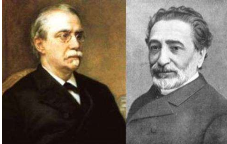
Antonio Cánovas del Castillo (1828-1897) y Práxedes Mateo Sagasta (1825-1903).

Todas estas prácticas fraudulentas se apoyaban en la abstención de una buena parte de la población, cuya apatía electoral se explica tanto por no sentirse representada como por el desencanto de las fuerzas de la oposición en participar en el proceso electoral. En general, la participación electoral no superó el 20% en casi todo el período de la Restauración.