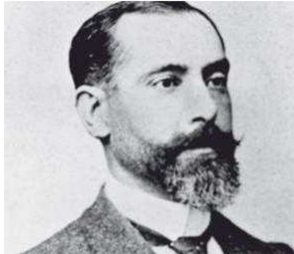
Sabino Arana y Goiri (1865-1903).

una burguesía supuestamente moderna. Los defensores de la recuperación íntegra de los fueros eran los perdedores de la guerra carlista. La industrialización y la masiva llegada de inmigrantes eran señaladas como enemigas de la sociedad tradicional vasca, junto con el gobierno liberal español que había recortado sus fueros.