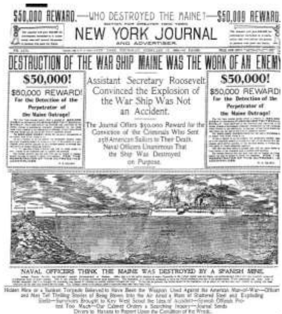
Periódico norteamericano con el hundimiento del Maine.

La derrota de 1898 sumió a la sociedad y a la clase política española en un estado de desencanto y frustración. Para quienes la vivieron, significó la destrucción del mito del