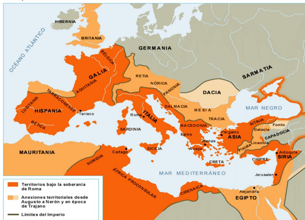
El Imperio Romano

La conquista militar, con ser fundamental, no fue la labor más relevante protagonizada por los romanos; lo verdaderamente especial fue la conversión de ese vasto territorio en una inmensa área comercial y de comunicación cultural sostenida por una red de calzadas y ciudades nunca antes conocida y construida por grandes ingenieros. Y para el control y gobierno de ese mundo diverso y global a la vez, los romanos crean un sistema administrativo y jurídico. En todos estos lugares el latín se convierte en lengua oficial y facilita la comunicación entre los pueblos. Y Roma, la urbe, con su órgano de gobierno fundamental que es el senado, es el corazón de este enorme imperio.