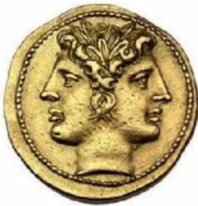
4 Moneda que representa al dios Jano

JANO es uno de los dioses romanos más antiguos y no tiene equivalente en ningún otro panteón. Se le representa con dos caras, que miran a oriente y a occidente, de ahí que se le conozca como "bifronte" y "gémino". Se le atribuía el patrocinio de los pasos, las transiciones y de los comienzos y finales. Es el dios de la mañana, del primer día del mes, del comienzo del año y del siglo. A él encomendaban los romanos todos sus proyectos y negocios. Es el dios de las puertas por lo que sus símbolos son una llave y un báculo. Tenía un templo en el foro cuyas puertas estaban abiertas en tiempo de guerra y cerradas en tiempo de paz.