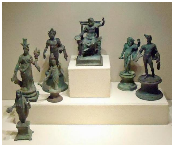
1 Estatuillas de dioses de un larario

Se trató de una religión en constante evolución: al principio los romanos eran animistas, pues adoraban a la potencias o fuerzas de la naturaleza: entes divinos sin sexo, sin nombre, sin cara, representados por "piedras" llamadas "betilos", como el "lapis niger" que se encuentra en el foro. Los primeros dioses carecen de personalidad concreta, son más bien entes abstractos, numina , ligados a una tarea o función muy concreta (como Abeona, que protegía al niño al alejarse en sus primeros pasos, o Adeona, cuando regresaba). Posteriormente algunos de estos entes divinos se fueron antropomorfizando y adquiriendo personalidad. La influencia etrusca y griega fue fundamental para dar el paso a representaciones en forma de estatuas y al cambio de una religión animista a una religión politeísta. En época imperial se llegó a divinizar a la misma Roma y a sus emperadores, en tanto que ganaron terreno nuevas creencias y dioses, como Mitra, Isis o el cristianismo.