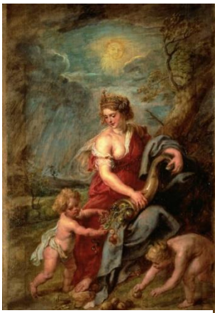
5 diosa Ops, "la abundancia", esposa de Saturno. Rubens

QUIRINO era un dios de origen sabino, protector de campesinos y pastores. Otra versión afirma su origen romano, interpretándolo como el dios en que fue divinizado Rómulo a su muerte. Pasa a ser un dios guerrero (de curis , lanza, en sabino). La palabra Quirites, derivada de su nombre designa a los romanos. Le estaba consagrada la colina del Quirinal y unas fiestas el 17 de febrero.