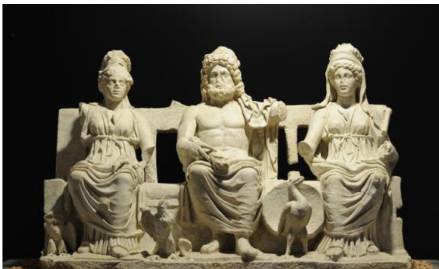
6 Tríada capitolina Júpiter Óptimo Máximo, Juno y Minerva

La influencia etrusca fue fundamental para la construcción de los primeros templos, la adivinación de la voluntad de los dioses por medio de la observación de las vísceras de los animales sacrificados, como veremos más adelante, y la introducción de nuevas divinidades etruscas, como VULCANO, MERCURIO, o VENUS, o griegas y asimiladas a divinidades etruscas. Recordemos que los romanos eran muy abiertos a la adopción de un nuevo dios si ello les procuraba alguna protección especial. A partir del siglo III a. C. el panteón irá conociendo un crecimiento paralelo al de las fronteras de Roma: el número de dioses aumenta, al tiempo que se produce la fusión de divinidades latinas y griegas, proceso que no afectó a deidades secundarias. Esta apertura religiosa tenía un valor también diplomático, para ganarse el favor de las colonias griegas del sur de Italia o, por ejemplo, la alianza del rey Átalo de Pérgamo frente a Aníbal cuando se introdujo el culto a la diosa Cibele.