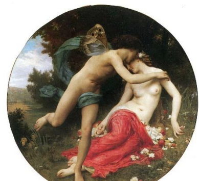
3 Flora era Cloris en la mitología griega. Cloris y Céfiro

Los dioses originariamente romanos se llamaron INDIGETES ( indiges es una palabra de significado oscuro que se ha interpretado como “indígena”, “hablante interior”, “invocado”) y eran JÚPITER (padre de los dioses), SATURNO (dios de la siembra), MARTE (dios de la cosecha), FAUNO (dios de los rebaños), FLORA (diosa de la primavera y de la juventud) SILVANO (dios de los bosques), POMONA (diosa de los frutos), etc. Muchos de ellos no pasaban de ser representaciones de cualidades abstractas. A estos se les adoraba en lugares naturales, en donde a veces se levantaban algunos altares.